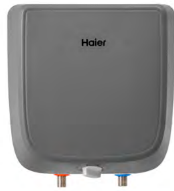
ES10V-Q1(R) Монтаж над мойкой