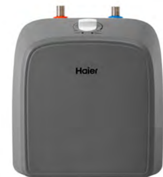
ES10V-Q2(R) Монтаж под мойкой